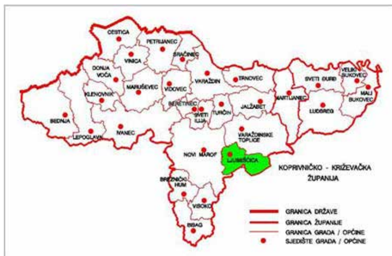
Slika 1. Smještaj Općine Ljubešćica u Varaždinskoj županiji

Općina Ljubešćica nalazi se u sastavu Varaždinske županije na njenom jugoistočnom dijelu. Jedna je od 22 općine i 6 gradova. Na zapadu graniči s Gradom Novi Marof, na sjeveru s Gradom Varaždinske Toplice, a južno i istočno sa susjednom Koprivničko - križevačkom županijom (Slika 1). Općina se prostire na 35,6 kvadratna kilometra što iznosi 2,82 % od ukupne površine Županije. Prema popisu stanovništva iz 2011. godine Općina Ljubešćica ima 1 858 stanovnika, iz čega proizlazi da je gustoća naseljenosti 52 stanovnika/km 2 .