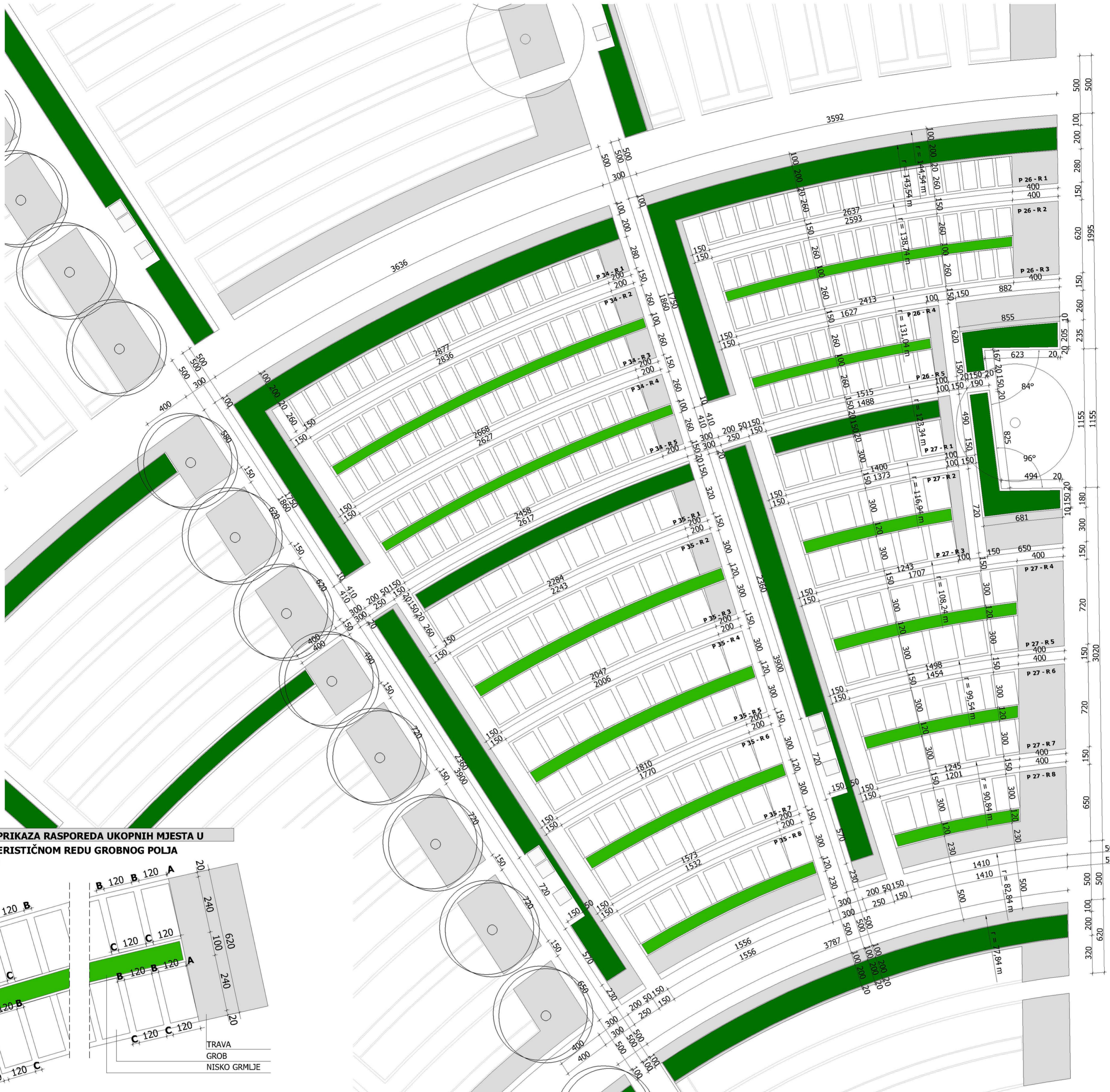
DETALJ PRIKAZA RASPOREDA UKOPNIH MJESTA U KARAKTERISTIČNOM REDU GROBNOG POLJA M. 1:100